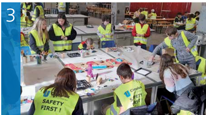
3. ATTIVITÀ DI BRICOLAGE E DISEGNO SVOLTE IN OFFICINA / DO-IT-YOURSELF AND DESIGN ACTIVITIES IN THE WORKSHOP